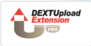
[DEXUpload Pro Extension]